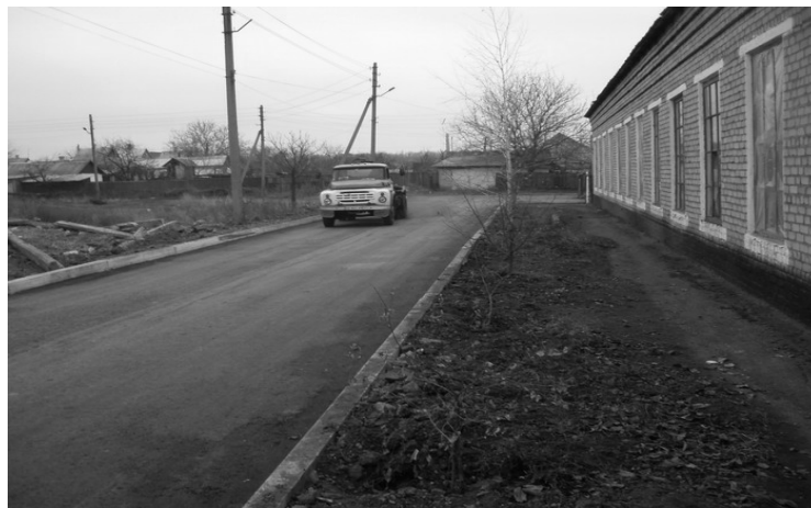
Рисунок 4 – Экспериментальная городская улица г. Антрацит. Эксплуатация 1 год

Результаты лабораторных испытаний вырубок асфальтобетона из экспериментальных покрытий приведены в таблице 2.