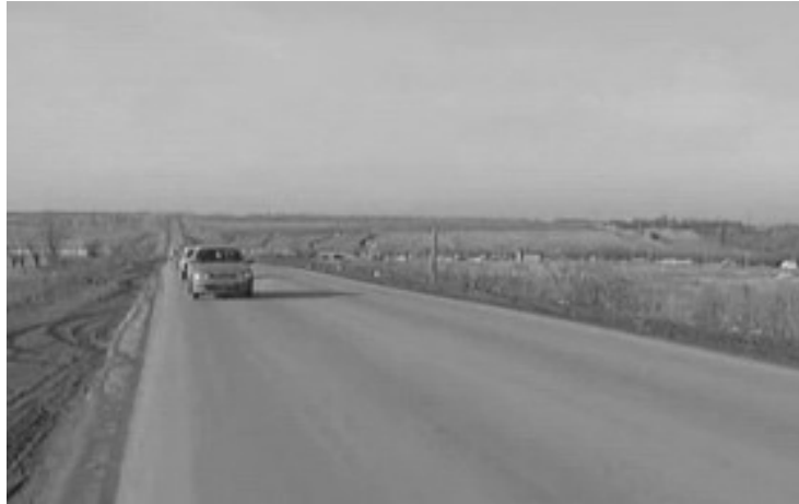
Рисунок 3 – Экспериментальный участок объездной автодороги вокруг г. Луганска. Эксплуатация 3 года