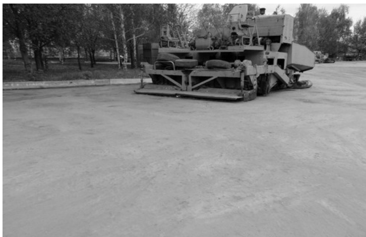
Рисунок 2 – Площадка для тяжелой техники в г. Луганске (МДПМК-34). Эксплуатация 6 лет

Визуальный осмотр всех экспериментальных покрытий выявил их отличное состояние (рисунки 2-4).